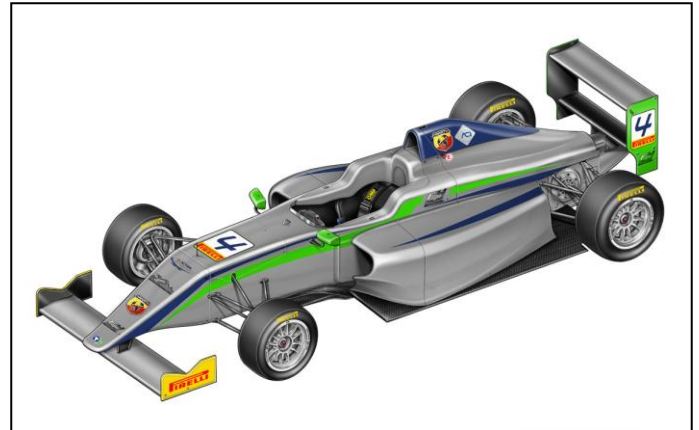
LA PRIMA IMMAGINE GRAFICA DELLA FORMULA 4 TATUUS-ABARTH GOMMATA PIRELLI.